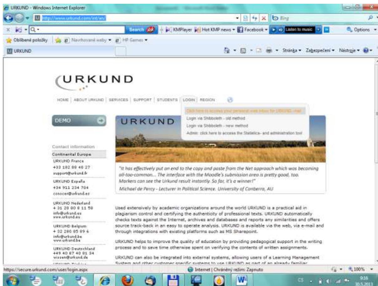
Obrázek 1. Přihlášení do aplikace URKUND

Poté je třeba zadat uživatelské jméno a heslo a dojde k přihlášení do aplikace.