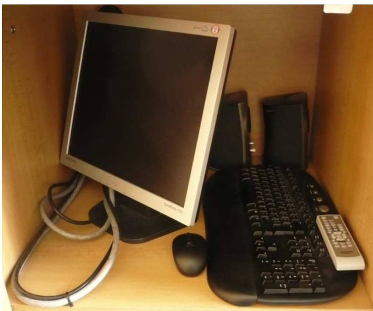
Obsah levé části úložného prostoru katedry (Obr. 1).

Pro používání počítače, postavte monitor, klávesnici a myš na katedru. Ke spuštění projektoru slouží bílý ovladač (Obr. 1). K zapnutí projektoru je třeba stisknout jednou a k vypnutí dvakrát tlačítko pro zapnutí projektoru. Ke spuštění plátna, slouží kolébkový přepínač visící na el. kabelu před tabulí.