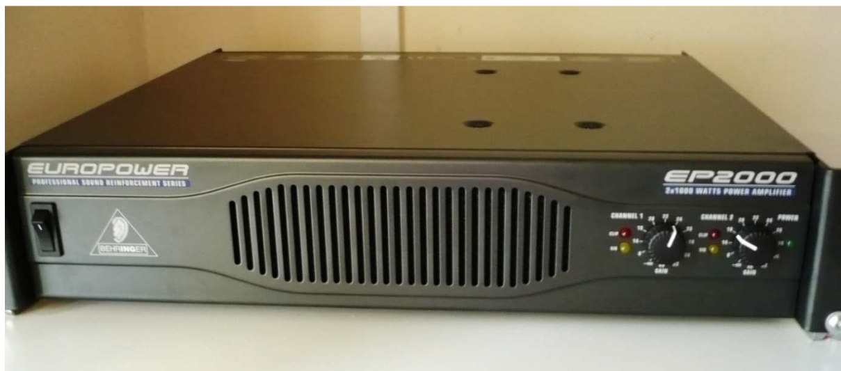
Přípojný bod pro notebook (Obr. 5)

Na skříní s technikou se nachází zesilovač ovládající reprosoustavu (Obr. 5) v místnosti. Dbejte prosím na to, abyste po použití, vždy zesilovač vypnuly.