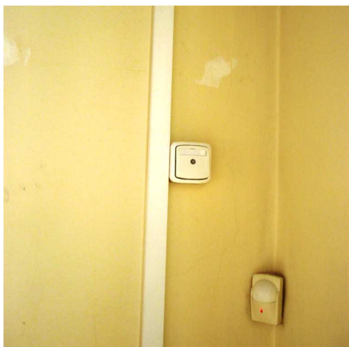
Vypínač nad skříní s počítačem (Obr. 2).

Aby šel projektor spustit, musí být zapnutý vypínač (Obr. 2).