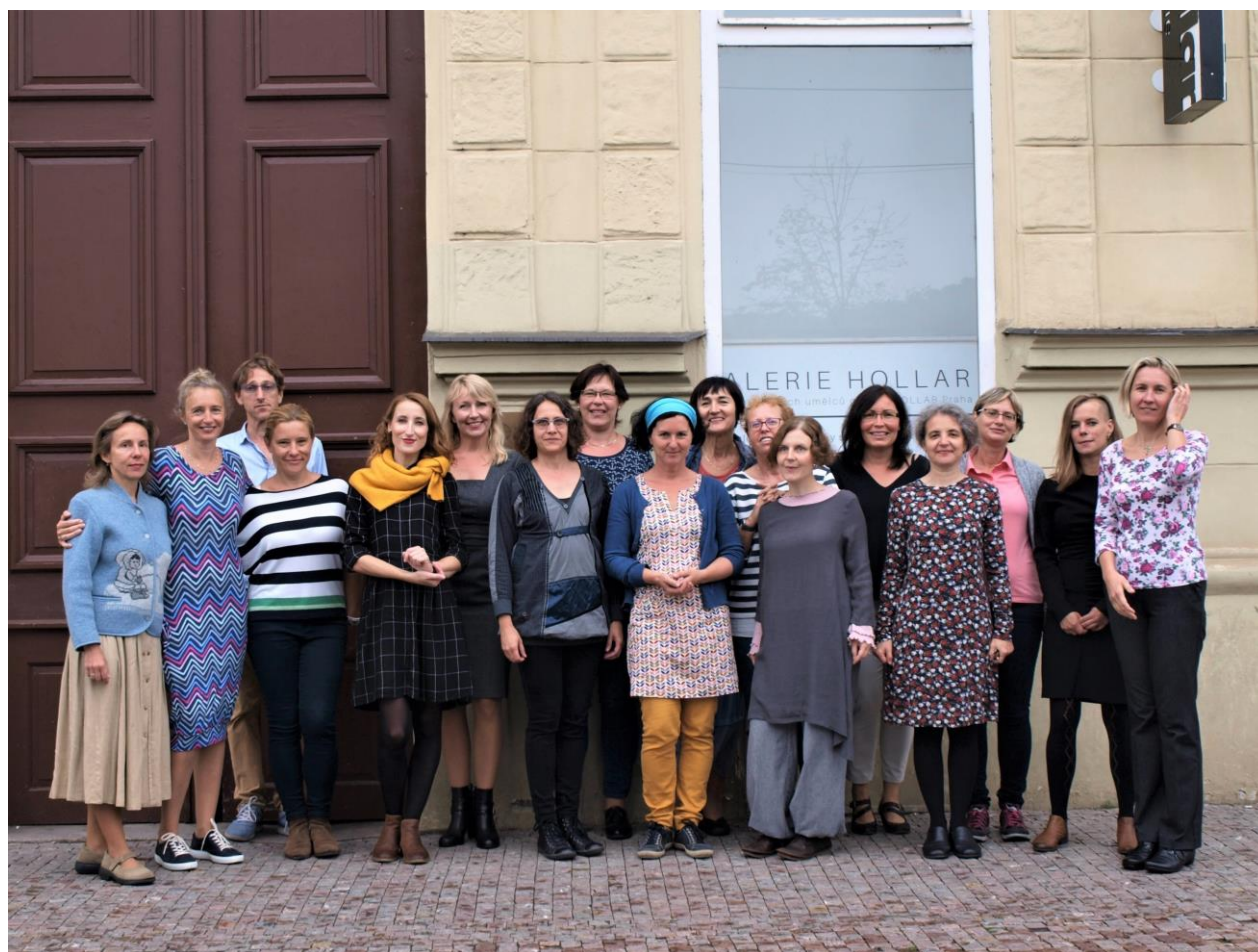
9. 9. 2019 před poradou v Hollaru