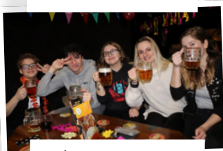
Vítání letního semestru