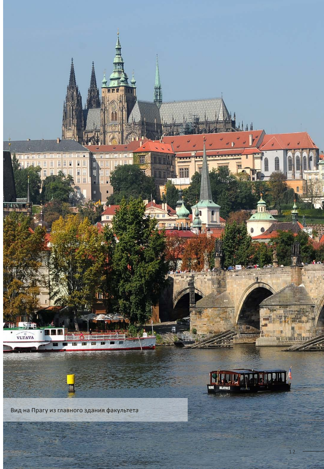
Вид на Прагу из главного здания факультета

http://fsveng.fsv.cuni.cz/FSVEN-362.html